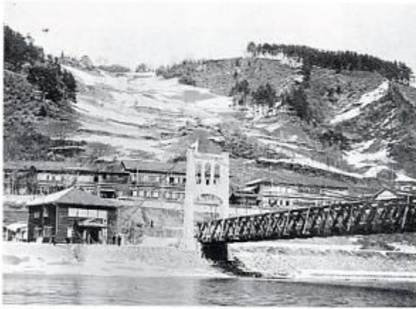
昭和12年3月 陸郷小学校と陸郷役場