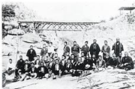
大正末年の下生坂青年団（大正9年2代目の橋）