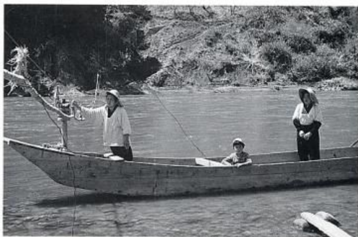
昭和39年4月 生坂最後の上生坂上舟渡