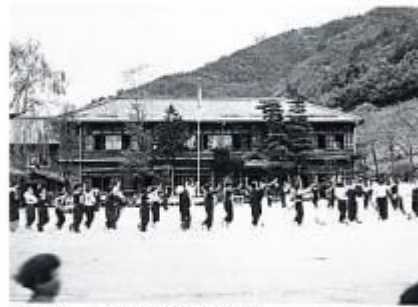
昭和13年 高分散地で区民運動会