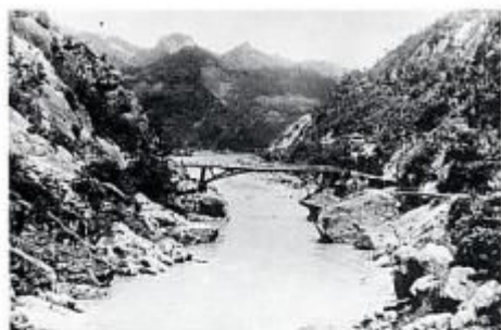
大正7年ごろの山清路（明治34年初代の山清路橋）