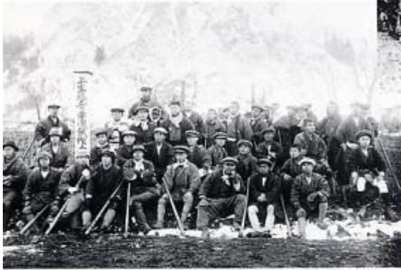
大正初年 上生坂青年団の試作楽園作り