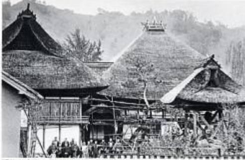
明治30年代 照明寺の生坂小学校 (左の庫裏)