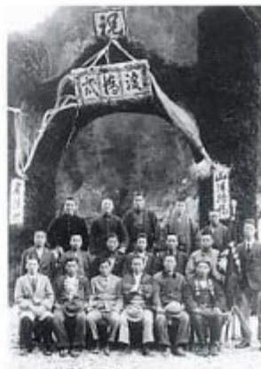
昭和9年10月 山清路橋渡初式の会青年会