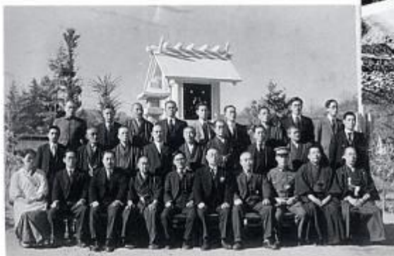
昭和16年4月 奉安殿建設記念 大日本国防婦人会のたすきが見える。