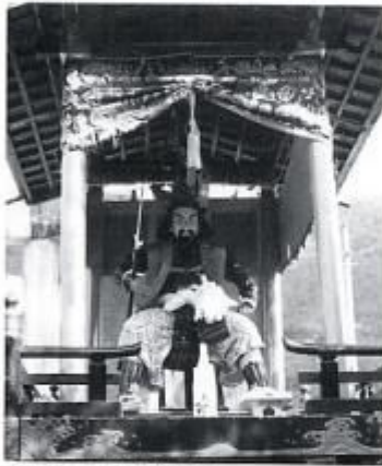
大日向の加藤清正像とだし