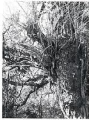
震根の乳房イチョフ