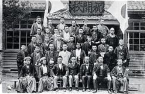
明治36年6月 生坂小学校開校祝い