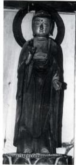
白日大岩の阿弥陀立像 約300年前虫蔵山屋の 作 高77cm