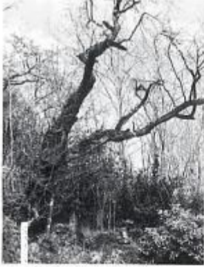
上生坂そっとう坂のひばり桜