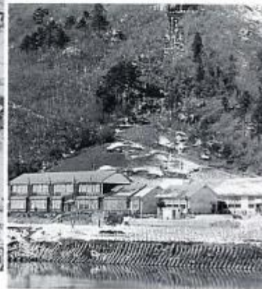
昭和40年代の生坂北小学校