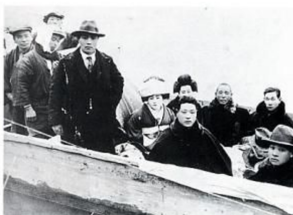
船で下生野へ来た花嫁さん（昭和4年）