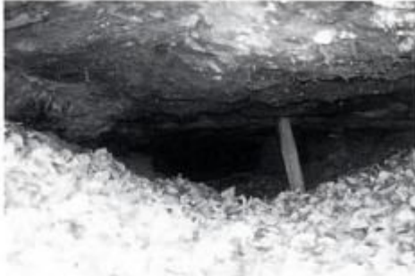
池天炭坑 明治20年代から昭和30年ごろまで掘り続け、一時は150人近く働いていた。