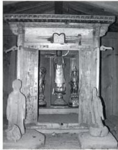
小立野入岩州の薬師堂内 古仏、薬師、日光月光