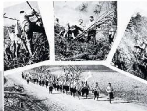
昭和16年2月 食糧増産奉仕隊