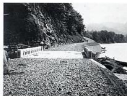
昭和10年ごろの池沢口 渡船と舟水車がみえる