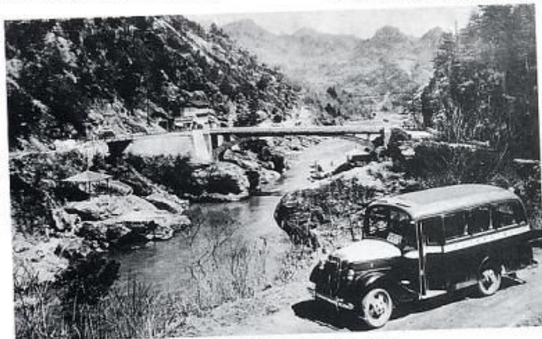
昭和13年山清路へバスが来る（昭和9年3代目の橋）