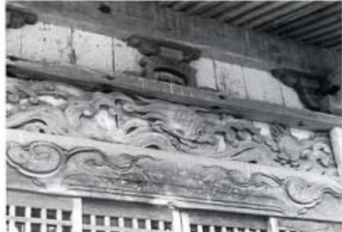
下生野五社の彫刻 国訪の立川和四郎の高第 石井佐兵衛の作