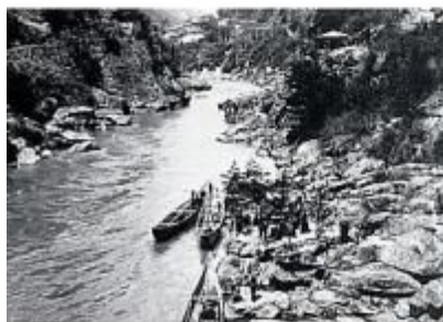
大正末年の山清路下り