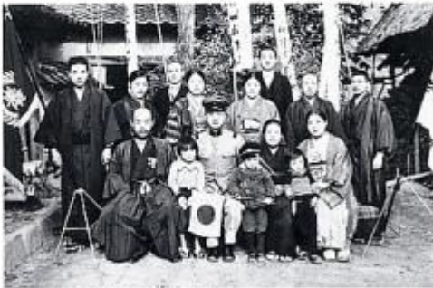
昭和12年10月 日中戦争の召集