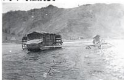
昭和2年ごろ 上生坂の舟水車、右は天神草屋（粉ひき、割ひき）