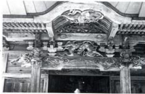
宇留賀の大日堂の彫刻 講訪立川流浅川豊八の作か