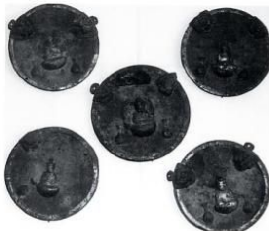
上生坂日置神社の Yatai no Kagami 彫仏 江戸初期