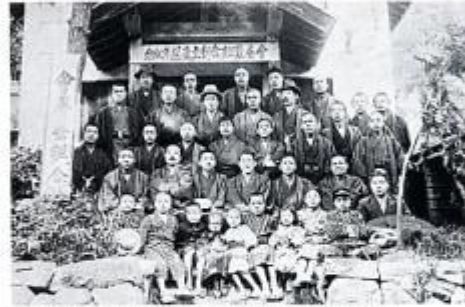
大正12年 会豊蚕組合1周年記念(広津遊覧出所)