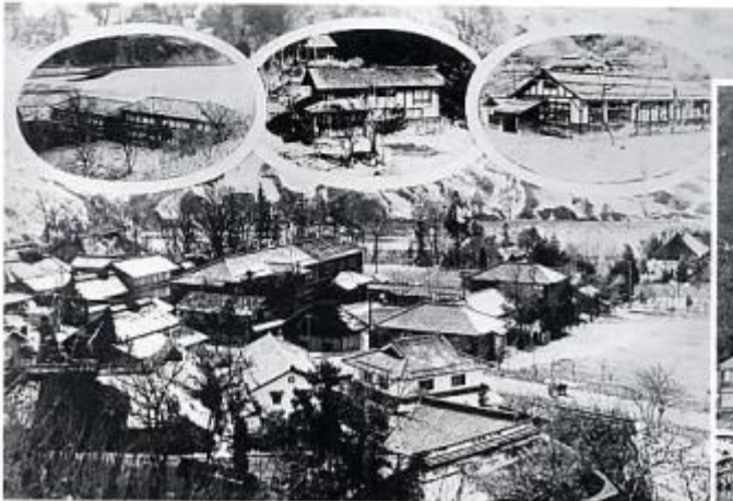
昭和16年3月生坂村の小学校 (左)小立野分校 (中)入山分校 (右)込地分校 生坂小学校