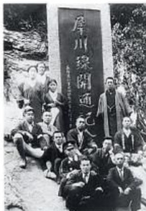
昭和13年開通記念碑建記念