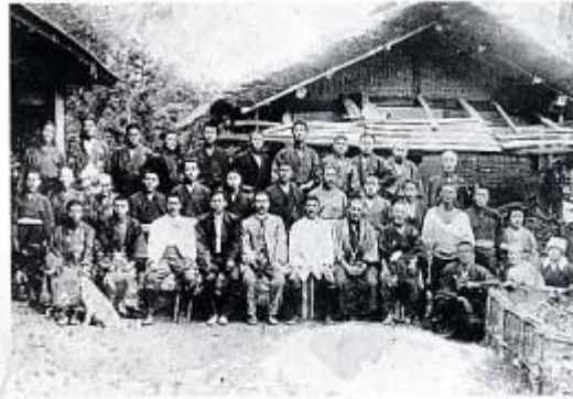
大正6年 大日向申塚のたばこ組合