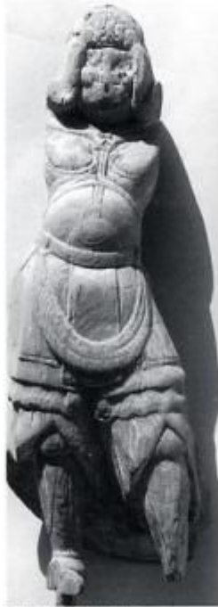
草尾の鹿沙門天小像 室町初期の作 像高42cm